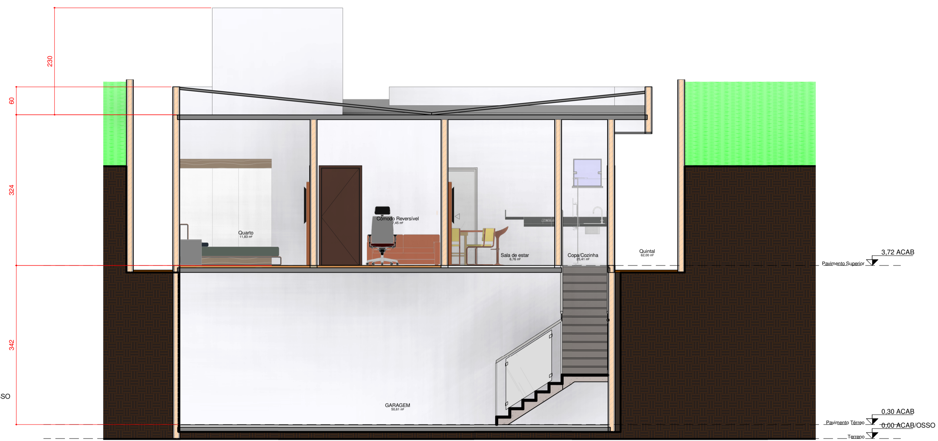
2 CORTE B 1 : 50