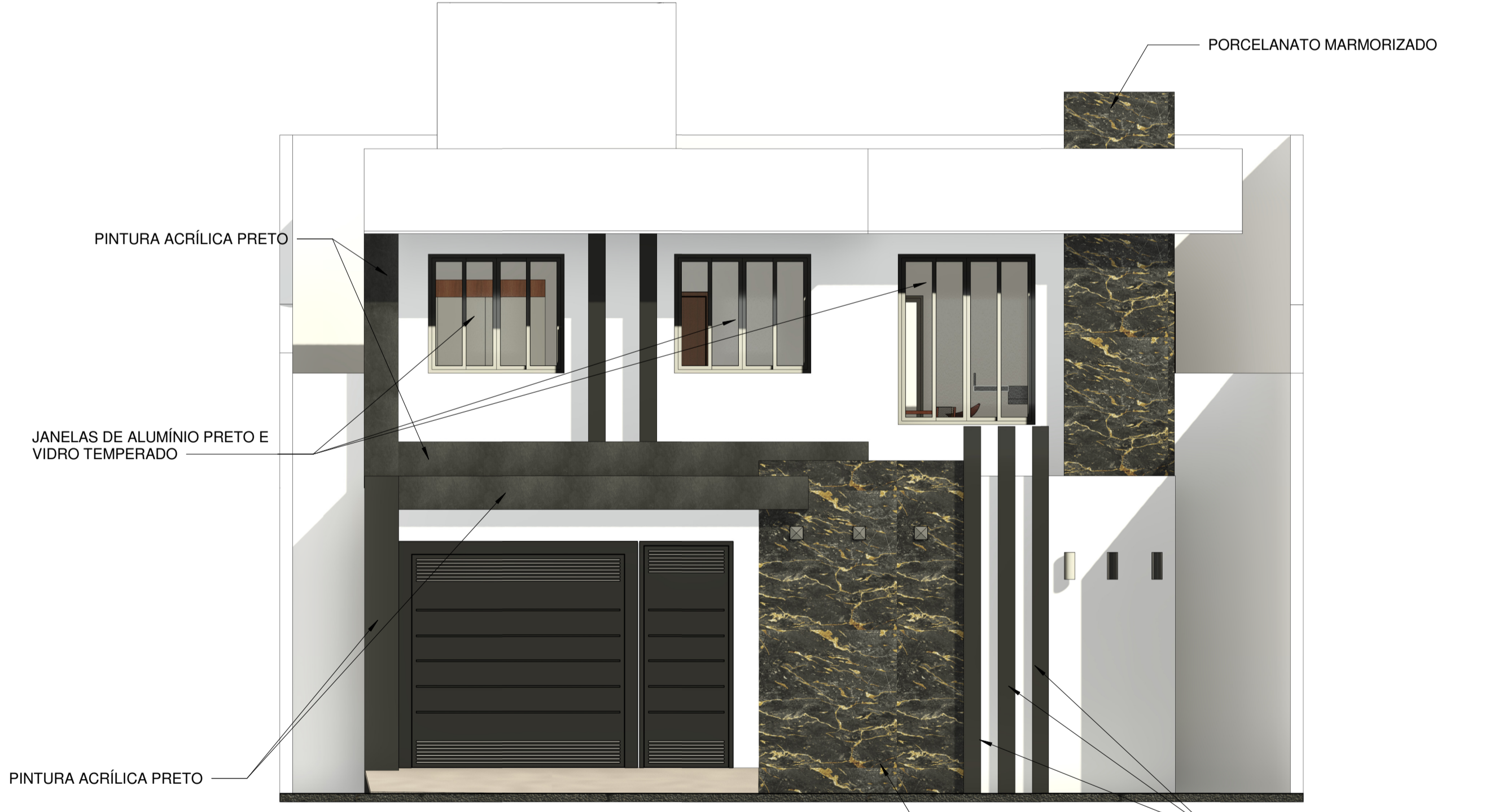
5 FACHADA SIMPLIFICADA