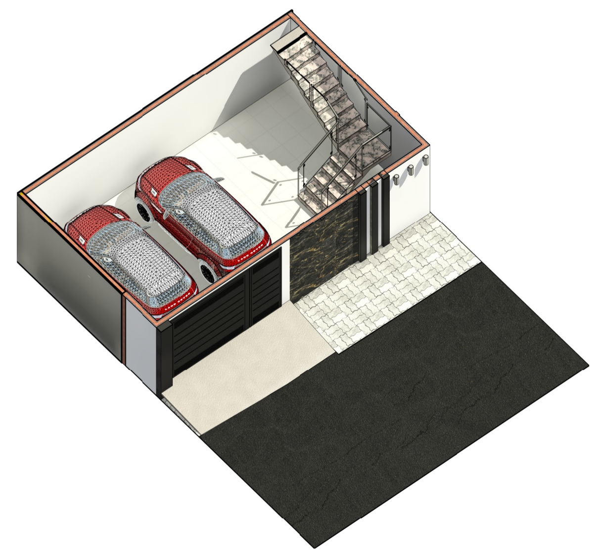
4 PERSPECTIVA TÉRREO 2